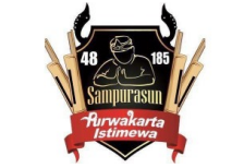
Para Seniman Tampilkan Seni Tradisional Berbagai Negara