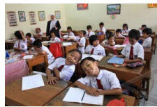
Bekasi Mulai Realisasikan Gedung Sekolah Baru