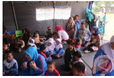
Karawang Anggarkan Rp7 Miliar Insentif Guru PAUD