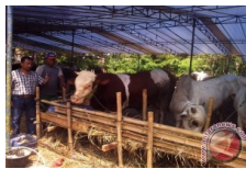
Biaya Transportasi Pengaruhi Harga Hewan Kurban Bekasi