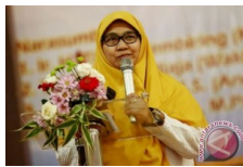
PKS Siapkan Tokoh Perempuan Berkualitas