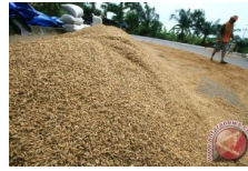
Tengkulak Diimbau Beli Gabah Dengan Harga Wajar