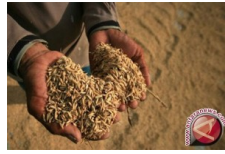
Pemkot Sukabumi Optimistis Capai Target Produksi GKP Negara